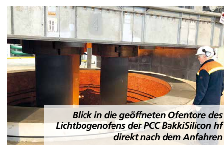
Blick in die geöffneten Ofentore des Lichtbogenofens der PCC BakkiSilicon hf direkt nach dem Anfahren

Umsatz und Ergebnis im Konzern. Letzteres gilt auch für die ebenfalls zu diesem Segment zählende Projektgesellschaft DME Aerosol, Pervomaysky (Russland), deren Produktionsanlage für Dimethylether (DME) im Herbst 2018 an den Start gehen soll. Bei der zweiten großen Projektgesellschaft dieses Segments, der PCC BakkiSilicon hf, stand der Produktionsstart dagegen ausgangs des ersten Quartals kurz bevor. Inzwischen, das heißt am 30. April 2018, ist das Zünden des ersten Ofens für die Produktion von Siliziummetall auch erfolgt.